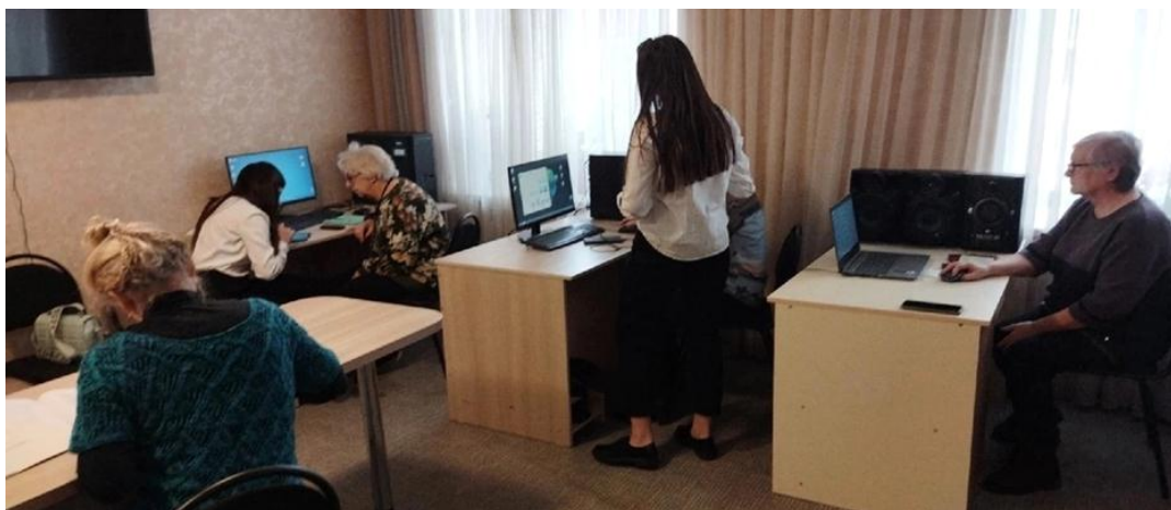
Фото 1. Курсы компьютерной грамотности для людей пенсионного возраста проводят волонтеры центра «Вместе – сильнее!»

навыком грамотного использования информационных каналов, социальных сетей, сайта «Госуслуги» и т.п. Эти курсы не только упрощают жизнь для их слушателей, но и создают благоприятные условия для межпоколенческого взаимодействия, обмена жизненным опытом и восполнения дефицита внимания, который зачастую встречается, как и у ребят-волонтеров, так и у получателей услуг.