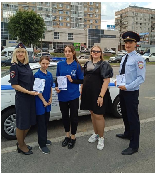
Фото 3. Акция «Грамотный пешеход» реализуется волонтерами центра «Вместе – сильнее!»

Совместно с РЭО ГИБДД УМВД Росси по г. Магнитогорску волонтеры центра «Вместе – сильнее!» участвуют в различных акциях. Например, акция «Грамотный пешеход», целью которой является привлечение населения к правилам дорожного движения.